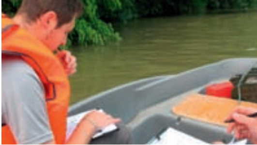
Reconnaissance de terrain sur l'Adour