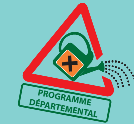
Désherbage thermique de la voie verte à Villeneuve-de-Marsan